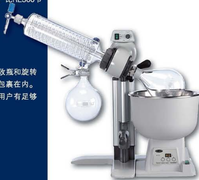
RE300 和 RE300DB