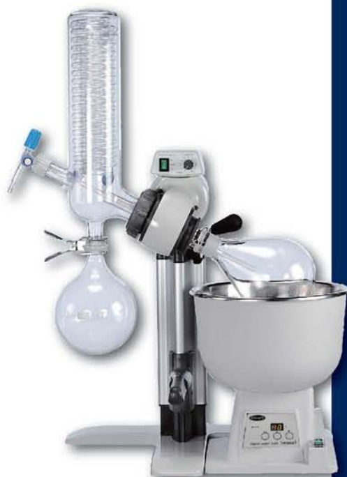
RE301 and RE300DB

配置为：带塑料涂层的冷阱冷凝器，冷凝排管用于冷阱冷凝器，蒸汽管用于冷阱冷凝器，带塑料涂层的1000ml接收瓶，带塑料涂层的1000ml Florentine烧瓶，带活塞的补液管，真空密封塞，圆锥形连接夹子，球形连接夹子。