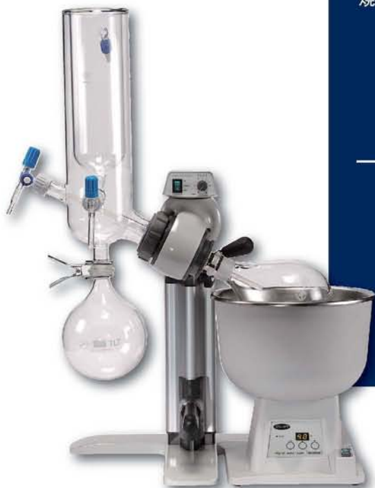
RE302 and RE300DB